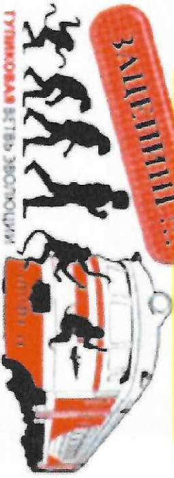
ГИБКОЕ СЕРДЦЕ ЭВОЛЮЦИЯ!

Ежегодно в России регистрируются тысячи фактов травмирования подростков на железных дорогах, более половины из них погибают!